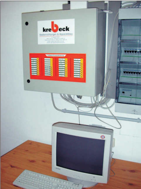
Zentrale, bestehend aus: Lastschrank mit Computer und Tastatur