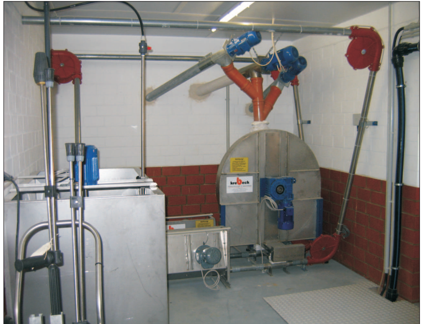
Gruppenwiegemischer: Futtermengen werden für mehrere Ventile zusammengefasst. Anlage im Parallellbetrieb.

Die computergesteuerte Trockenfütterung zeichnet sich durch ihre solide Konstruktion und Ausführung aus. Sowohl bei Um- als auch bei Neubauten hat sie sich durch ihre Anpassungsfähigkeit bewährt.