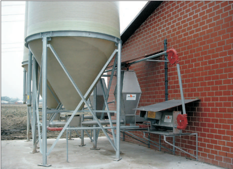
Teilautomatische Trockenfütterung für bis zu 4 Futtersorten